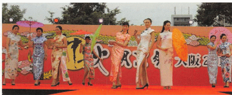
チャイナドレスショー