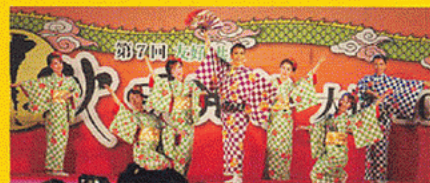
OSK 日本歌劇団特別公演